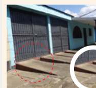
Por construcción de rampas que sobre pasan el nivel de andén