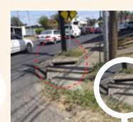
Por tragantes pluviales que se les roban la tapadera.