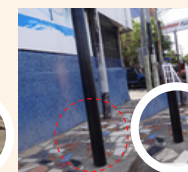
Postes de rótulos